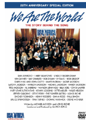
©1985 United Support of Artists For Africa, 2004 USA for Africa

⑬We Are The World ザ・ストーリー・ビ・ハイト・ザ・ソング 20th アニヴァーサリー・スペシャル・エディション